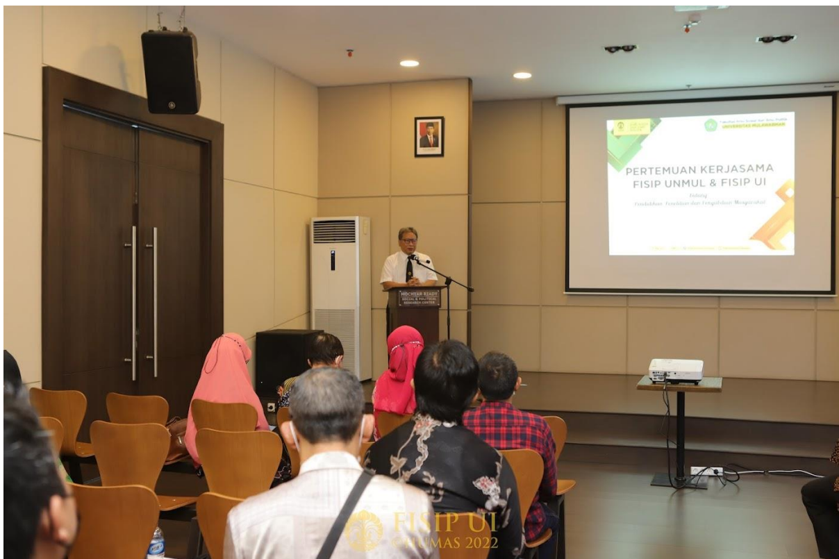
Sambutan Ketua Dewan Guru Besar FISIP UI