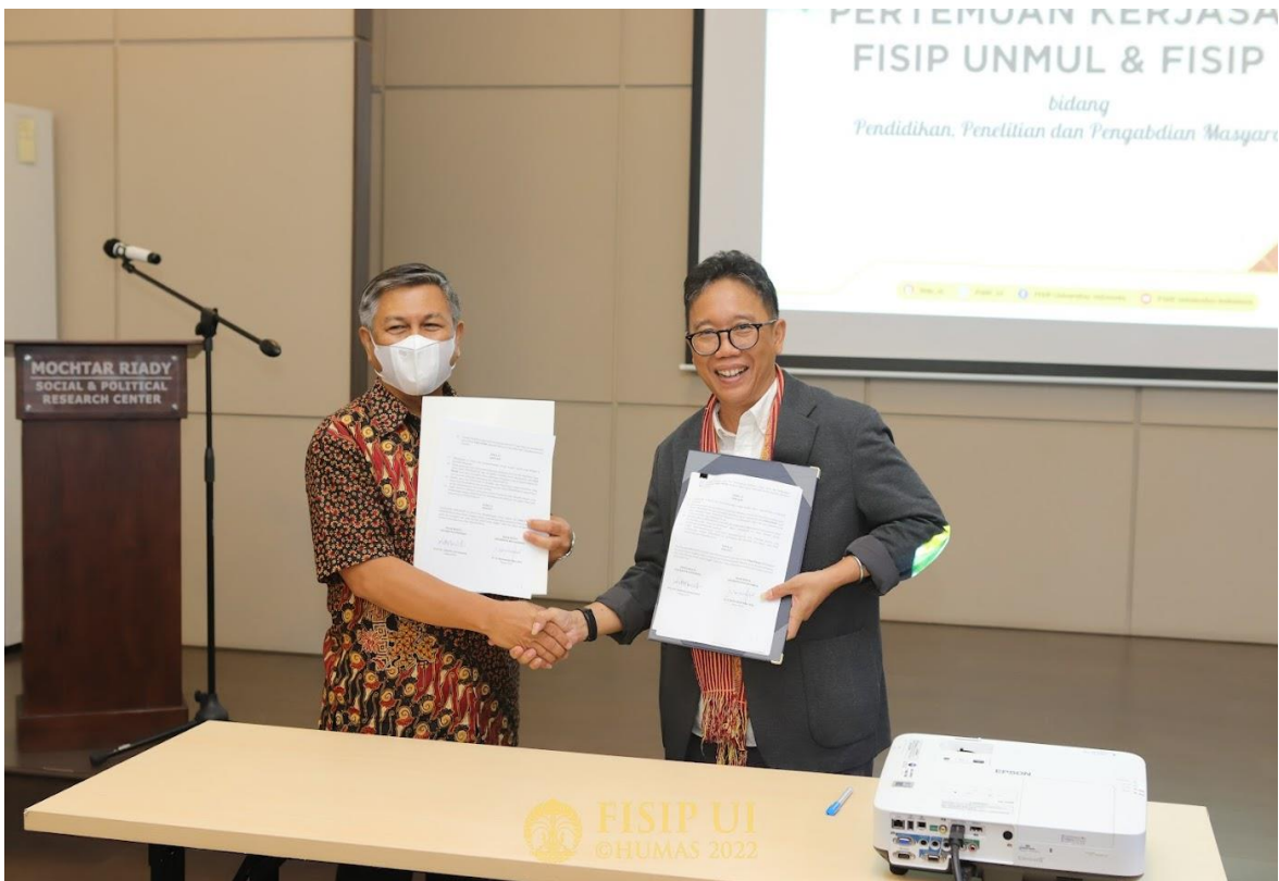
Penanda tangan PKS FISIP-UNMUL-FISIP-UI