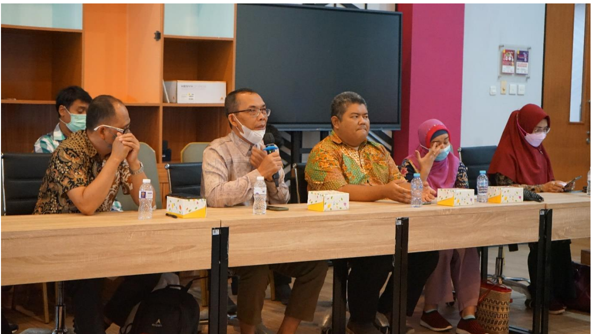
Mendengarkan pemaparan dari SPM FIA-UI